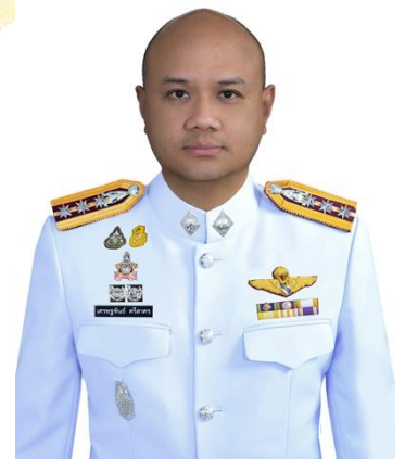
พ.ต.อ.เศรษฐพันธ์ ศรีสาคร